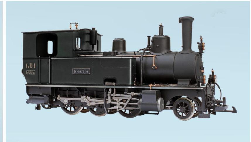
Version im Zustand nach der aktuellen Revision.