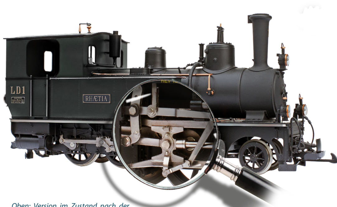
Oben: Version im Zustand nach der aktuellen Revision mit Türen